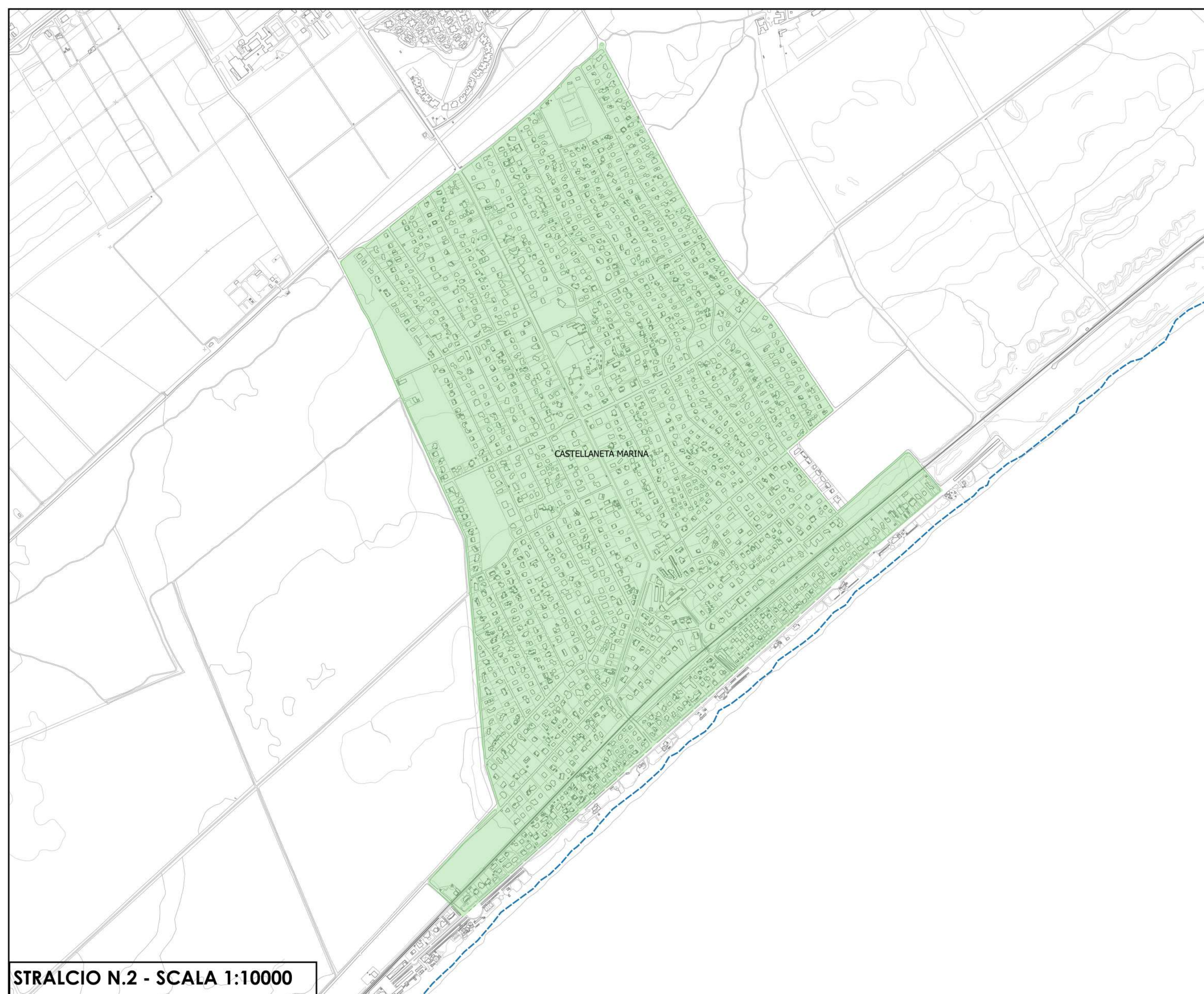
STRALCIO N.2 - SCALA 1:10000