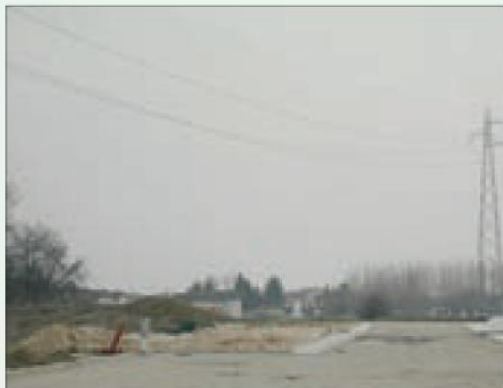
Situazione pericolosa per presenza di linee elettriche aeree in tensione non protette