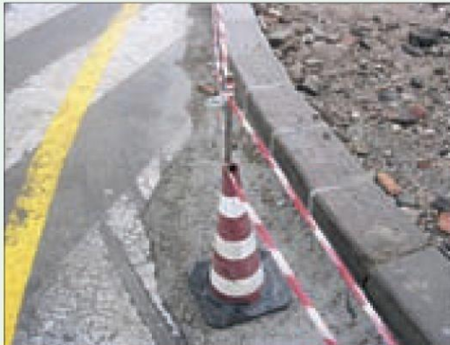
Situazione non regolare, il ferro sporgenti dal cono non è protetto