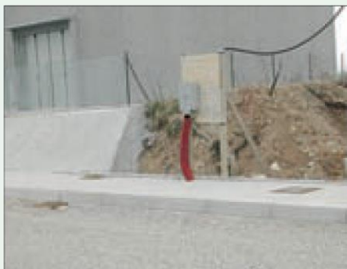
Situazione regolare, gli elementi in tensione sono correttamente protetti