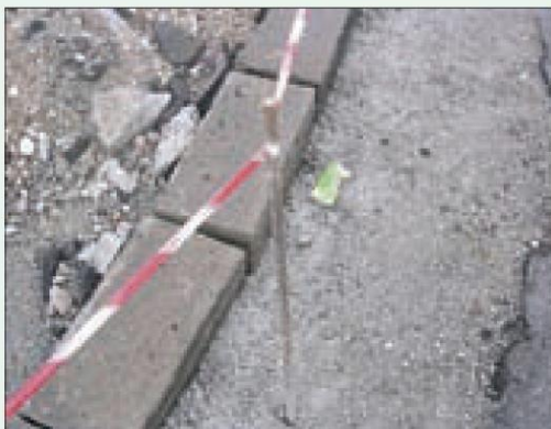
Situazione non regolare, il ferro sporgente dal suolo non è protetto