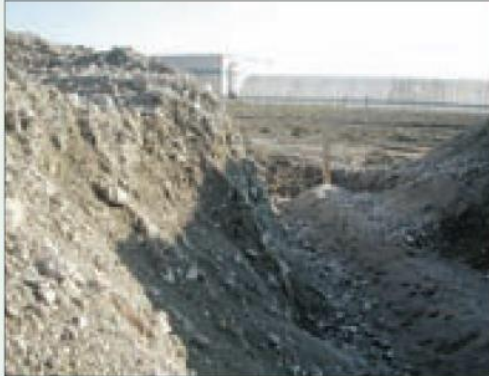
Situazione non regolare, dal fronte dello scavo possono cadere dei sassi