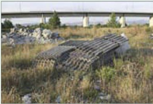
Situazione non regolare, materiale con possibile contenuto di amianto abbandonato sul terreno

L'esposizioni a tali poveri comporta gravi danni all'apparato respiratorio e anche la possibilità di sviluppo di patologie neoplastiche, se sono presenti fibre di amianto, come i mesoteliomi.