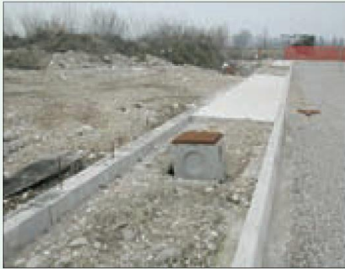
Situazione non regolare, i ferri sporgenti dal cordolo non sono protetti