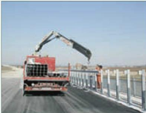
Situazione non regolare, i lavoratori sono privi di casco e il gancio dell'autogrù è privo di sistema antiganciamento

in cemento, pali, materiali minuti confezionati su bancali, o anche materiali di piccole dimensioni come sassi.