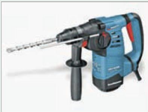
Esempio di attrezzo vibrante