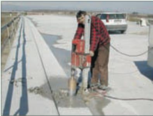
Situazione regolare, il lavoratore usa le cuffie