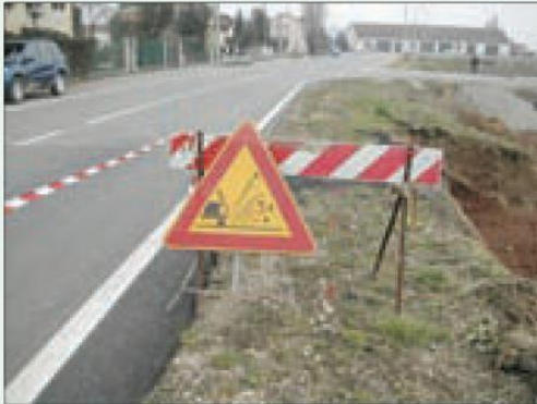
Situazione regolare, il ciglio della strada è pulito ed è presente idonea segnaletica