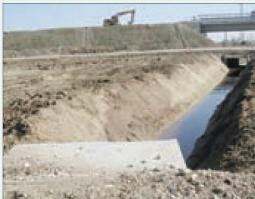
Situazione regolare, il fronte dello scavo è inclinato correttamente