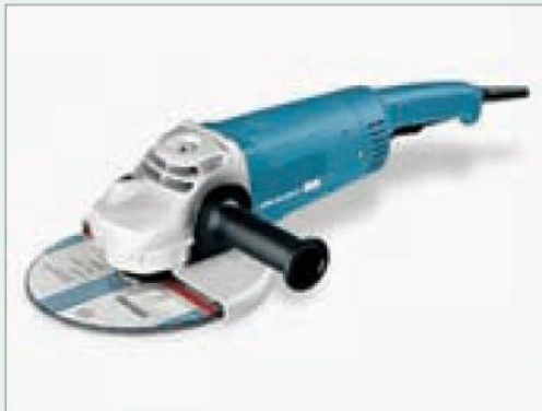
Esempio di attrezzo vibrante