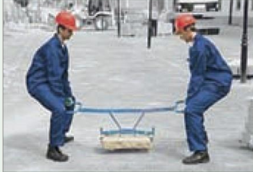
Esempi di movimentazione manuale dei carichi

La vigente normativa (Art. 169 D.Lgs. 81/2008) prevede che il datore di lavoro fornisca adeguate informazioni sui carichi da movimentare e provveda alla formazione dei lavoratori per una corretta esecuzione dell'attività