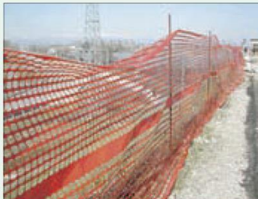
Situazione non regolare, la rete non è sufficiente per proteggere dalla caduta dal ciglio dello scavo