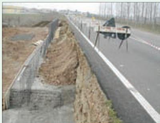
Situazione non regolare, il fronte dello scavo non è inclinato

L'attuale legislazione definisce lavoro in quota ogni attività lavorativa effettuata a 2 metri di altezza da un piano stabile. (art. 107 D.Lgs. 81/08 )