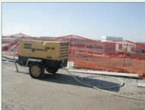
Esempio di macchina rumorosa