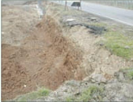
Situazione non regolare, il fronte dello scavo non è inclinato e può franare; non ci sono segregazioni dell'area alla base e sul ciglio dello scavo