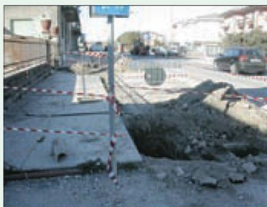
Situazione non regolare, il solo nastro non è sufficiente per proteggere dalla caduta nello scavo