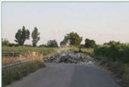
Situazione non regolare, rifiuti abbandonati sul ciglio della strada

In caso di rinvenimento di materiali o rifiuti con possibile contenuto di amianto è obbligatorio fermare i lavori e richiedere l'intervento di un'impresa specializzata, che provvederà a presentare il piano di lavori di bonifica allo SPISAL di competenza.